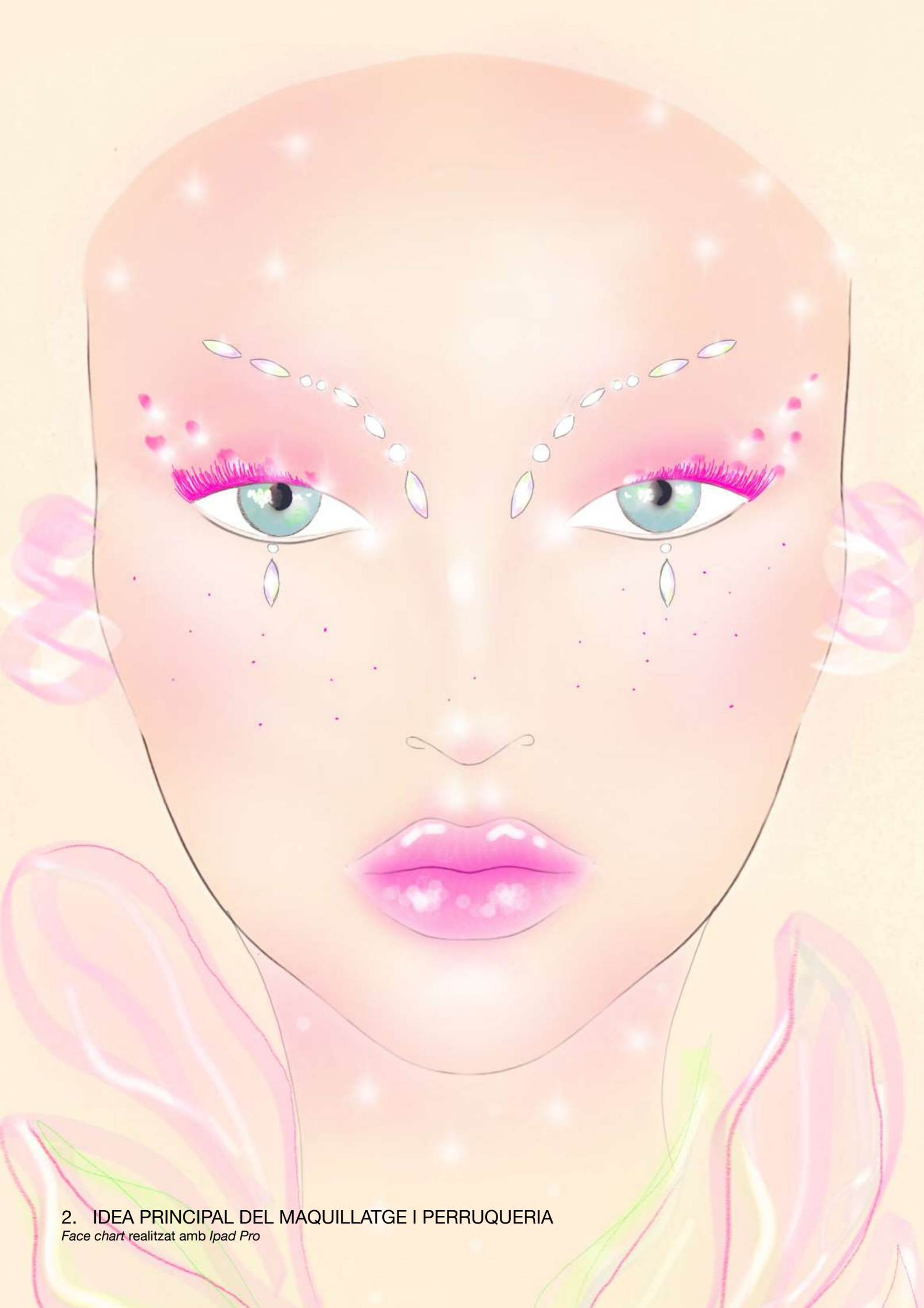
2. IDEA PRINCIPAL DEL MAQUILLATGE I PERRUQUERIA Face chart realitzat amb Ipad Pro