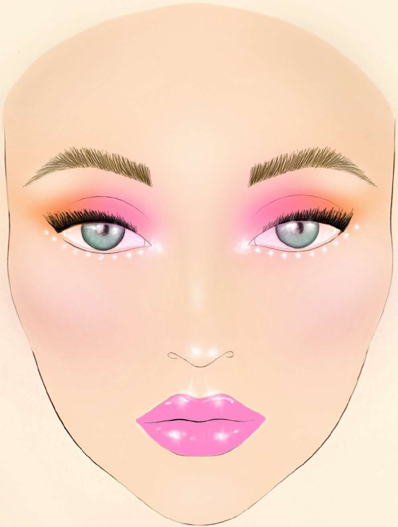
2. IDEA PRINCIPAL DEL MAQUILLATGE I PERRUQUERIA Face chart realitzat amb Ipad Pro